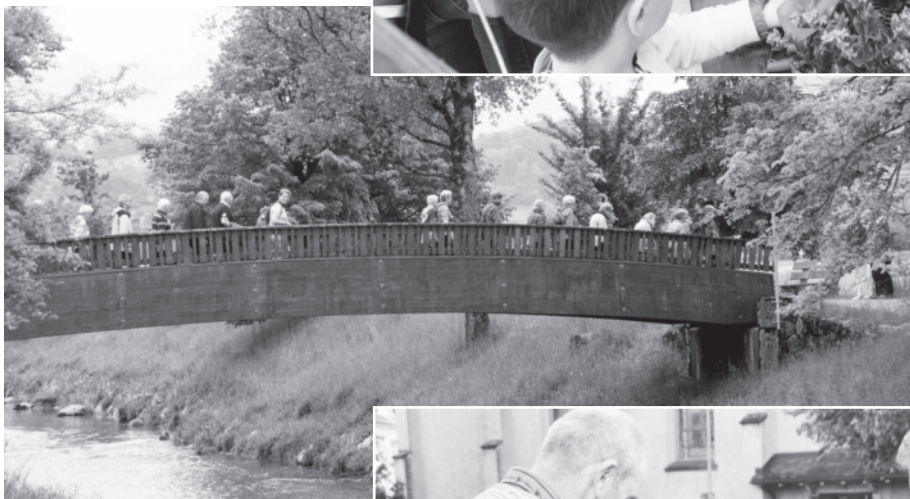
Bittgang KAB nach Maria Bildstein