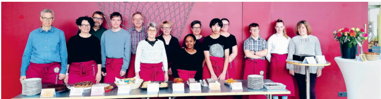
Helferteam am Suppenzmittag