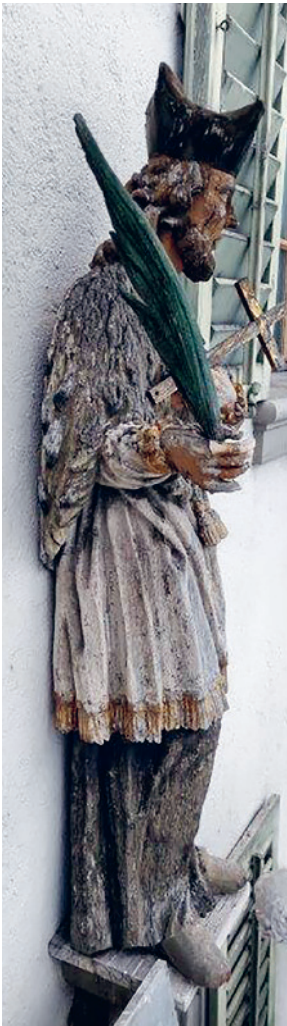
Hl. Nepomuk vor Restaurierung