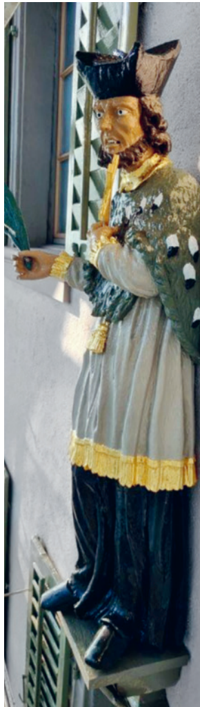
Hl. Nepomuk nach Restaurierung

Die Bauabrechnung weist einen Aufwand von CHF 1'141'545.10 aus. Gegenüber dem Kostenvoranschlag von CHF 1'250'000.00 sind das Minderkosten von CHF 108'454.90. Das heisst, das Projekt konnte um knapp 10% besser als im Kostenvoranschlag angegeben, abgeschlossen werden.