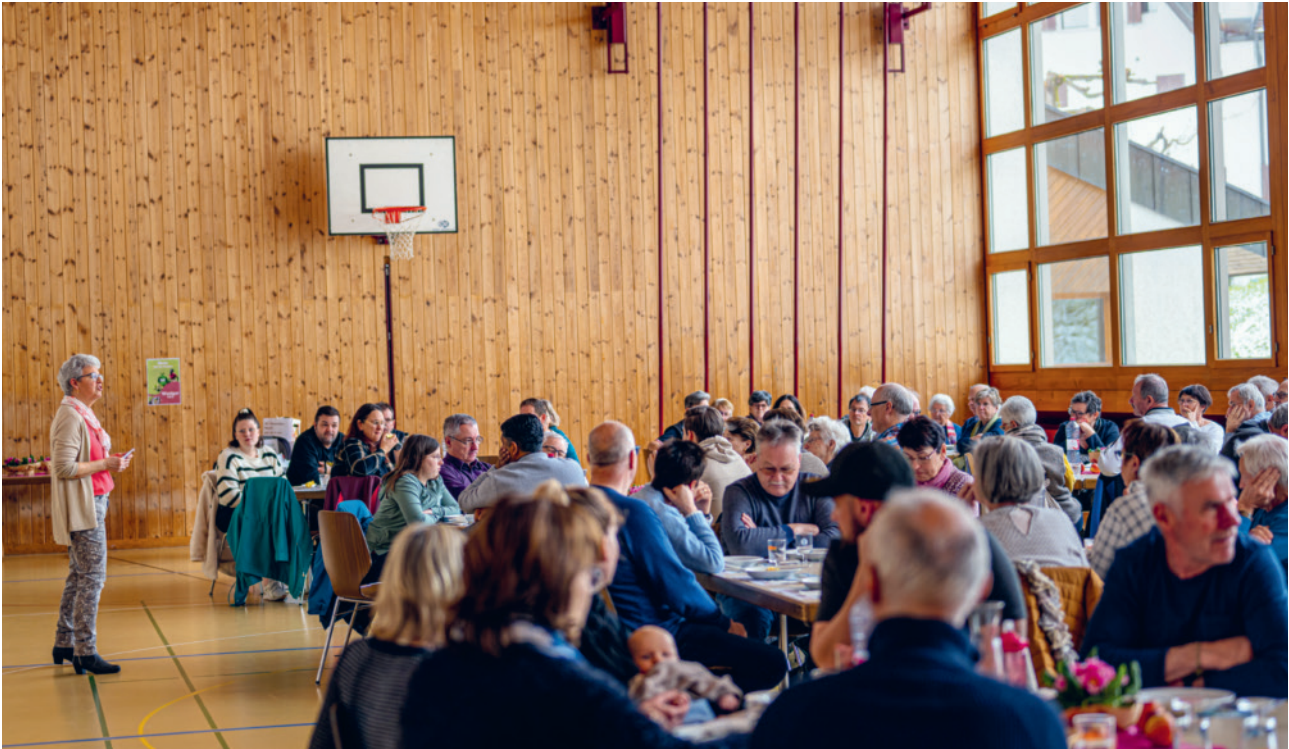
Palmsontag mit Suppenzmittag

Christbäume die Kirche schmücken und daran erinnern, dass bis 1970 die kirchliche Weihnachtszeit volle vierzig Tage gedauert hat.