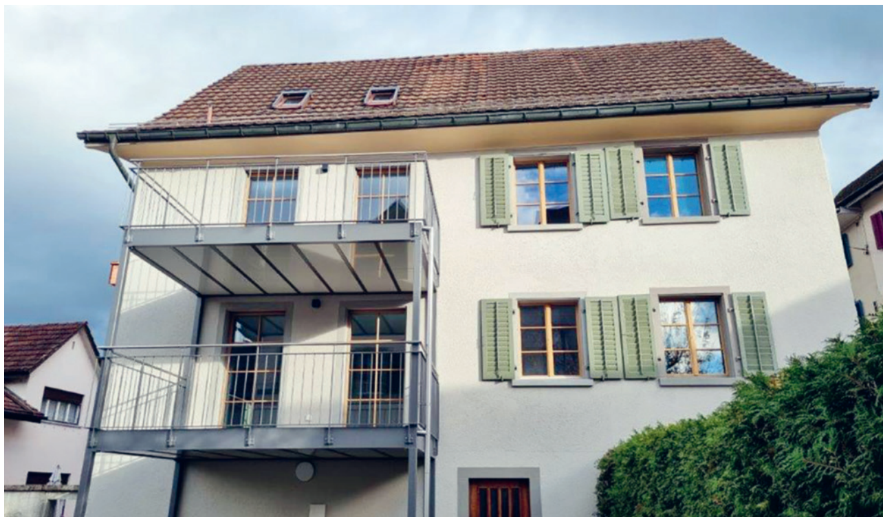
Westseite nach dem Umbau: zusätzliche Balkontüren inkl. Balkon/zusätzliche Fenster

umfangreichen Aussenarbeiten. Die Holzfensterläden wurden abgehängt und dann gereinigt und geschliffen. Morsche bzw. faule oder defekte Stellen ergänzt und anschliessend neu gestrichen. Gleichzeitig starteten die Arbeiten an der Fassade: Reinigung und Ergänzung von defekten Stellen, sowie Ausbesserungen an Steinelementen. Die Dachsanierung beinhaltete den Abbruch der bestehenden Bedachung, Erneuerung der Holzunterkonstruktion und Metallabdeckungen sowie der Dachrinnen und Ablaufrohre. Der Balkon auf der Nordseite wurde vergrössert und auf der Westseite neue Balkone montiert. Während des Maimarkts wurde das Fassadengerüst Süd aufgebaut, ohne dass die Kantonsstrasse ausserordentlich gesperrt werden musste. Die Holzskulptur des Hl. Nepomuk wurde ebenfalls wieder zum Strahlen gebracht. Mit dem Einbau der Fernwärmeleitung zwischen Tönierhaus und Pfarrhaus, wurde der erste Schritt für die gesamte Wärmeerzeugung aller Gebäude Uznach, gemacht. Mit der Bauabnahme im November 2023 konnte der Umbau des Pfarrhauses Uznach abgeschlossen werden.