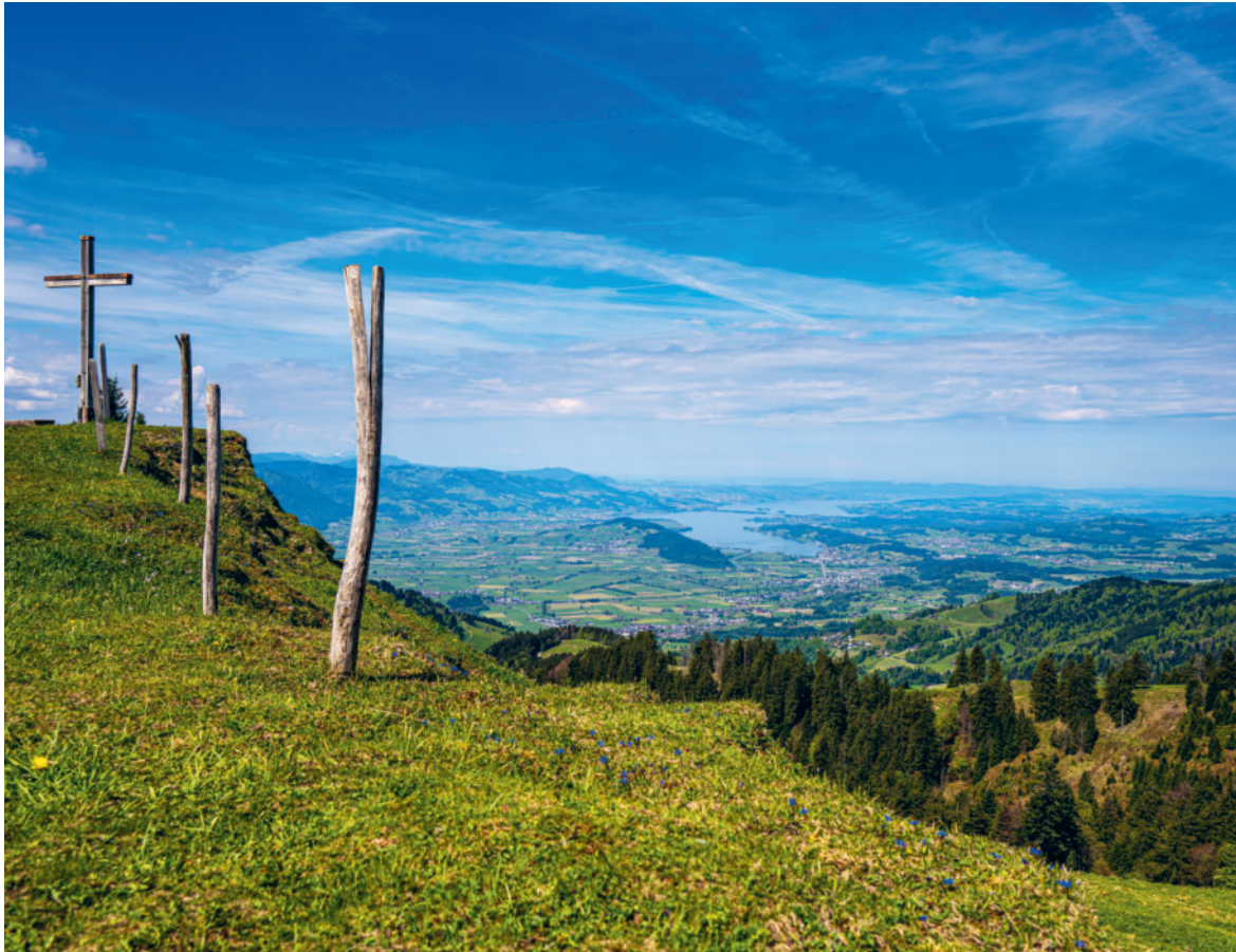
Tanzbodenkreuz, höchstgelegener Punkt der Kirchgemeinde