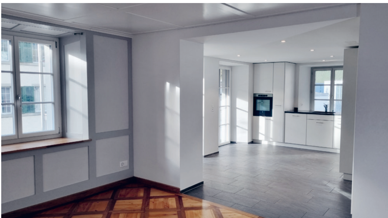
Küche nach Umbau: Durchbruch ins Wohnzimmer

Für den Kirchenverwaltungsrat August Kuster