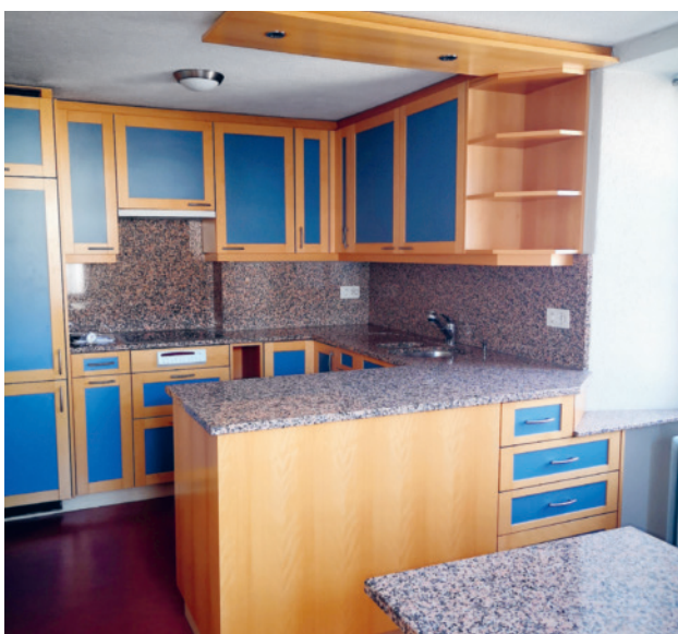
Küche vor dem Umbau