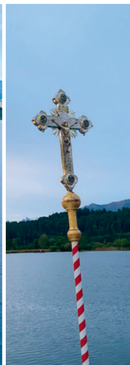
Impressionen der Wallfahrt nach Einsiedeln